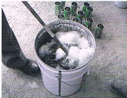
ハンドミキサーによる混練