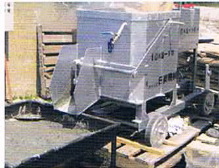
グラウトミキサー(3袋練り)