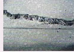
曲げ試験体のひび割れ面 (繊維による引張抵抗)