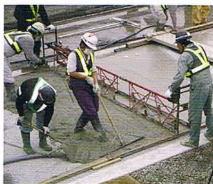
ポンプ圧送による流し込み