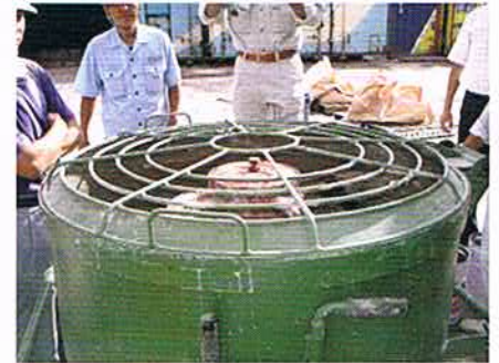
グラウトミキサー(400ℓ)