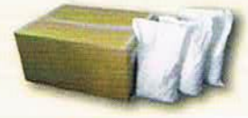
オートファイバー

※オートファイバーは20袋/CSです。 出来るだけ袋から出してほくしてお使いください。